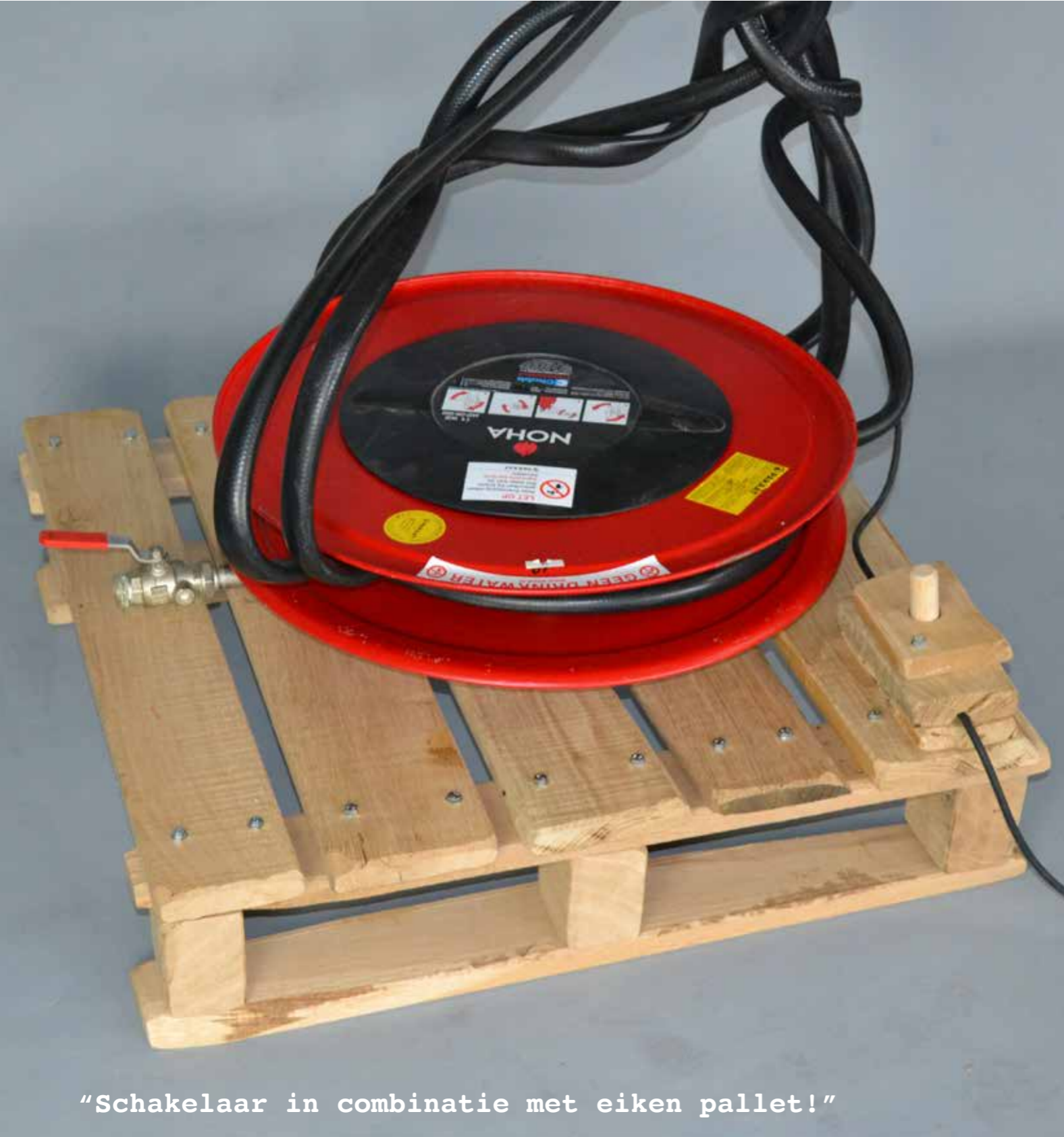
"Schakelaar in combinatie met eiken pallet!"