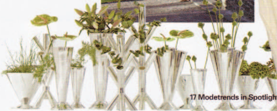
17 Modetrends in Spotlight