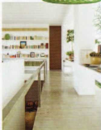
216 Moderne stadsvilla in Milaan