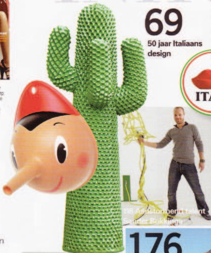
138 Amsterdamse talent Sander Bokkeveld